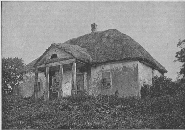
Фингола, гдѣ жилъ Гоголь. (Задняя сторона).

Въ домѣ еще больше воспоминаній. Они глядятъ на васъ со стѣнъ въ видѣ портретовъ: бывшего министра, Троицкаго, бабки и матери Гоголя и, наконецъ, самого его въ великолѣпной копіи художника В. А. Волкова съ портрета, писаннаго Моллеромъ въ Римѣ и на-